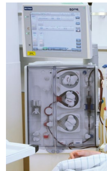
„An der Blutwäsche“ (Hämodialyse)